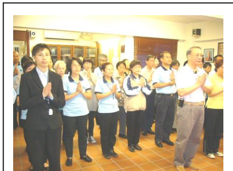
10月11日「共同參贊彌陀平等度生大業」發願大會