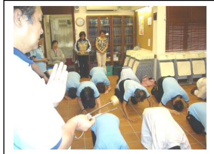
9月連續兩次講解及示範佛儀軌