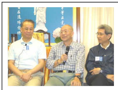
10月4日邀請區妙音師兄與同修分享其念佛體驗，及後共進晚餐